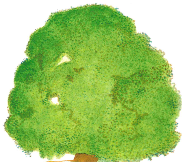
FARNIA ( Quercus robur L.; = Q. pedunculata Ehrh.)

The green expanses in the area, be they xerophyte or even hidric, include both indigenous arbours, meaning those that are typical of the area, and other imported arbours: these differ in that they come from either from the Mediterranean region or from very far away, as is the case of the Australian Eucalyptus. There is no doubt that the privileged species should be those that in all probability have been present in the area for over two thousand years; they thus date back to the origins of the archaeological area of the Port of Trajan and are therefore steeped in a historical flavour in relation to this specific place. This is the reason that induces us to start with these species that are also perhaps the most remarkable.