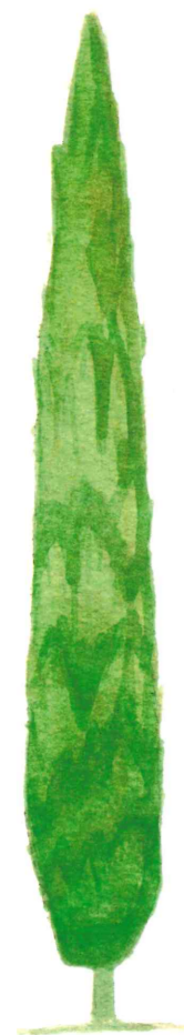
CIPRESSO ( Cupressus sempervirens L.); conosciuto come Cipresso comune

The scleroid Mediterranean vegetation also deserves a place in this list, that is to say those plants with resistant leathery leaves, with a particularly tough epidermis due to a thick layer of cuticle. The most important of these are the Holm oak, the Alaternus, the Mastic tree, the Filirea etc.