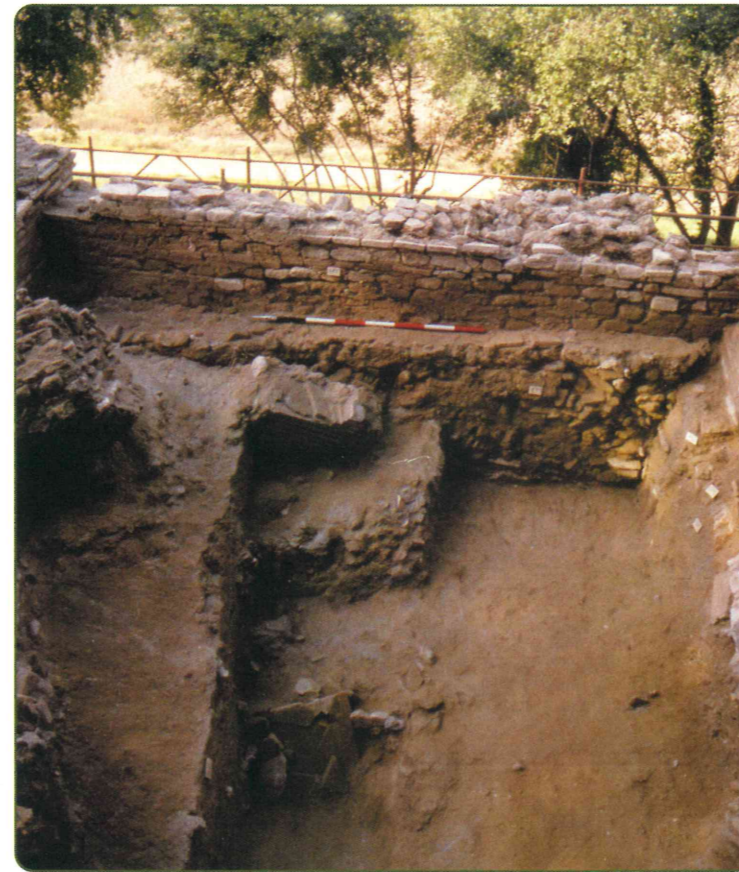
Il terrapieno a ridosso delle mura con sepoltura alla cappuccina

ancor oggi visibili, che sostenevano gli archi del cammino di ronda. L'abbandono definitivo di questi horrea non è databile con certezza ma potrebbe risalire alla fine del VI-inizi del VII secolo a giudicare dalla presenza al loro interno di sepolture databili a quel periodo. Un tratto delle mura tardoantiche che correva lungo il fronte settentrionale fu restaurato in epoca altomedievale. I laterizi e gli altri materiali di riempimento, disposti su filari ondulati, nonché il legante di malta sabbiosa, fanno associare questo intervento a quello avvenuto nello stesso periodo lungo il cd. Antemurale.