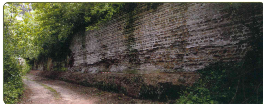
Muro tardoantico di tamponatura dei Magazzini di Traiano

The warehouses continued to be used to store goods right up to the end of the Roman Empire. A law contained in the Theodosian Codex dated AD 364 called for the restoration of the warehouses in Rome and those in the port, proving that these were still playing an important role at the time. Part of the north facade was reinforced between the 4 th and 5 th Centuries AD by a continuous wall in opus listatum (alternate layers of tuff bricks and tiles). At the end of the 5 th Century AD the two sides of the warehouses facing the canal leading into the Port of Trajan were incorporated in the fortified walls around the city and strengthened at the rear by pillars