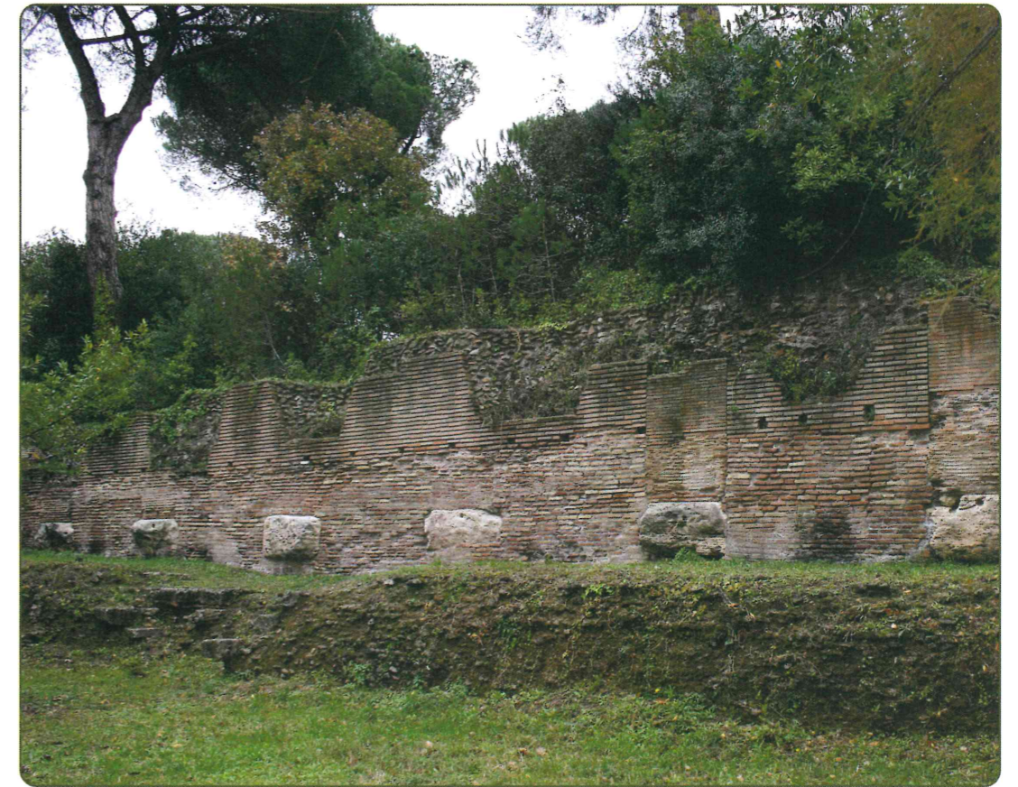
I Magazzini di Traiano inglobati nelle mura