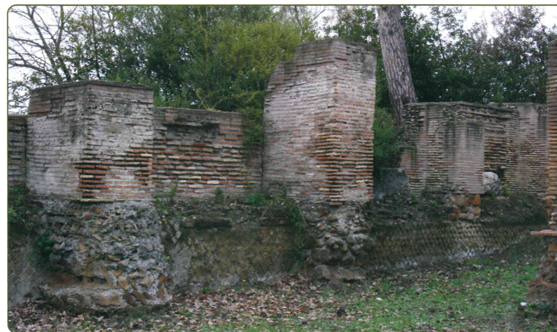
I pilastri di rinforzo sul fronte interno delle mura

that can still be seen today holding up the arches for the battlements. The actual date that these horrea (warehouses) were finally abandoned is not certain, but could be roughly the end of the 6 th Century or the early 7 th Century AD, given that tombs dating to this period have been found within them. One stretch of late antiquity wall running along the northern facade was restored during the Early Middle Ages. The bricks and other building materials laid in a staggered pattern and the sandy mortar would lead us to believe that the work was carried out at the same time as restoration of the Antemurale (outer walls).